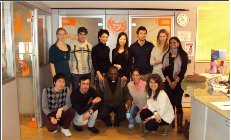
Tutti a scuola!